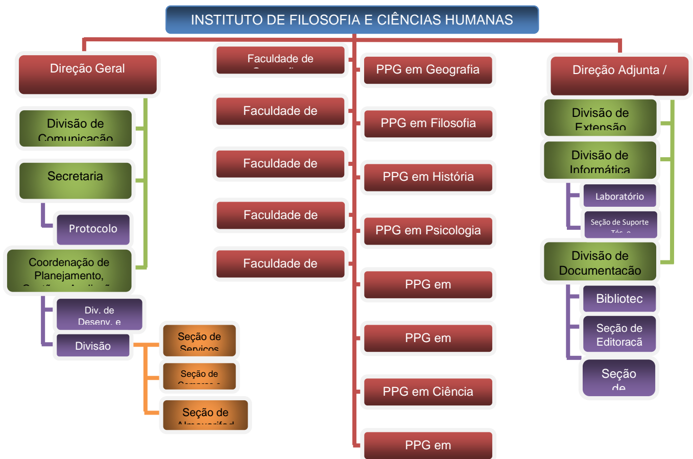
Figura 1: Organograma do IFCH

A estrutura formal do Instituto de Filosofia e Ciências Humanas é representada graficamente através do seu organograma atual, conforme figura 1: